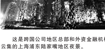
这是跨国公司地区总部和外资金融机构云集的上海浦东陆家嘴地区夜景。

截至9月底,外商累计在沪设立投资性公司237家,跨国公司地区总部347家,研发中心332家,居中国内地省市之首。