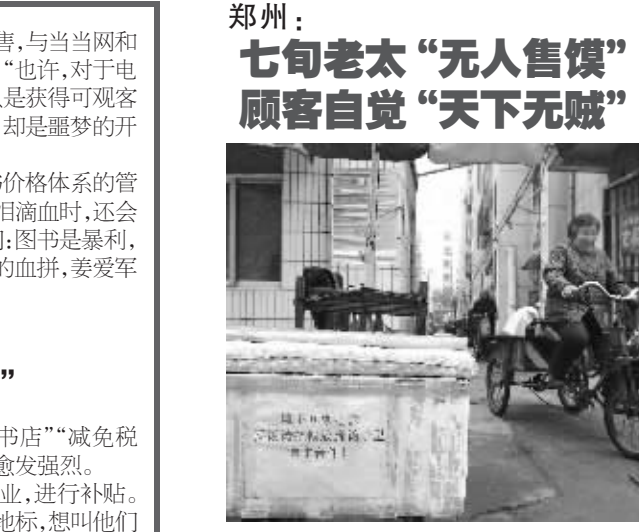
11月4日，张景珍骑车出门去进货。