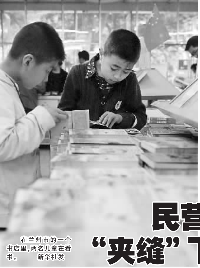
在兰州市的一个书店里，两名儿童在看书。