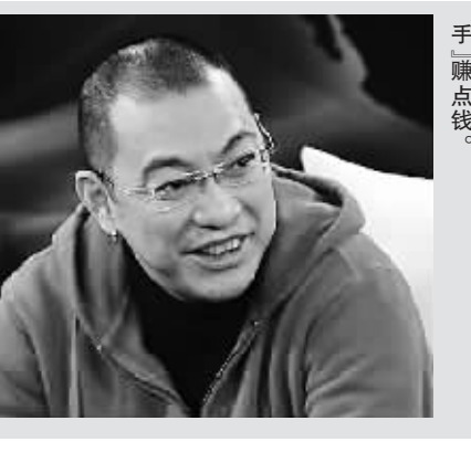
《武林外传》编剧宁财神说过,有手赚点钱。

剧集猛增 “枪手”泛滥 据透露,今年6月以来,影视圈各种资源抢得厉害,编剧稿酬相较于去年翻了一倍,刚入行的新编剧处女作都能拿到3万元一集,知名编剧的身价是10万元至20万元一集,一线编剧每集的稿酬甚至可达到30万元。据报道,2010年我国电视剧产量436部,1.47万集,为世界之最,中国电视剧的创作已进入了一个白热化的繁荣阶段。