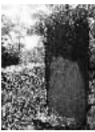
文昌龙楼山海村禁碑。