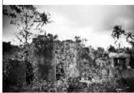
海口市潭社村古代官府示禁碑(中)因年代久远,石碑风化字迹模糊。

海南现存的一定数量的官府禁碑和乡规民约碑刻,大都是清代以后的,它们或立于田头路边,或倒在荒野废墟,或被收在博物馆内,命运各异,尽显沧桑,默默地记录了海南岛一些散落的文化痕迹,多少能让后人在其字里行间追忆那些日渐远去的故事。禁约采取勒石立碑的方式谕示,长期广而告之,使老百姓知法守法,有利于提高民众守法的自觉性;“村规民约”,则是以规范约束村民的日常行为。