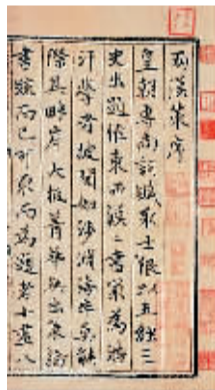
元抄本《两汉策要十二卷》