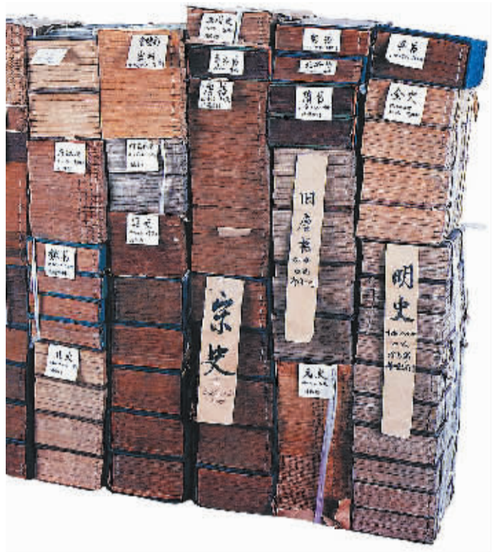
清同治光绪年间《二十四史》

善本书则一般可分为刻本和写本两大类,刻本包括历代用雕版或活字印刷的,主要为木刻的书籍,而写本包括稿本和抄本等几种。