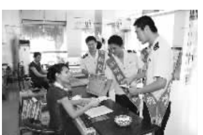
税务人员上门宣传税收政策法规。(罗荣 摄)

另一方面，我省国税部门积极利用信息化强化科学决策和科学管理。开发运行了海南国税数据仓库，按不同主题采集归并和分类存储了海南国税组建以来的所有税收征管数据上亿条，既强化了信息共享，也为强化征管质量考核、规范执法服务提供了依据。基于数据仓库提供的真实、全面、准确的数据信息，我省国税部门还设计开发了税收执法监督考核系统、税收征管质量评价系统、税收会计核算和税收统计系统、税收风险分析系统等决策支持系统，有效地提升了税收管理效能。(南瑞)