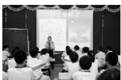
税务机关开展“税法进课堂”活动

工作的作风，反对办事拖拉、被动应付、推诿扯皮的不良习气，在全系统上下逐步营造了“人人抓效率、事事讲效率、处处显效率”的良好氛围。