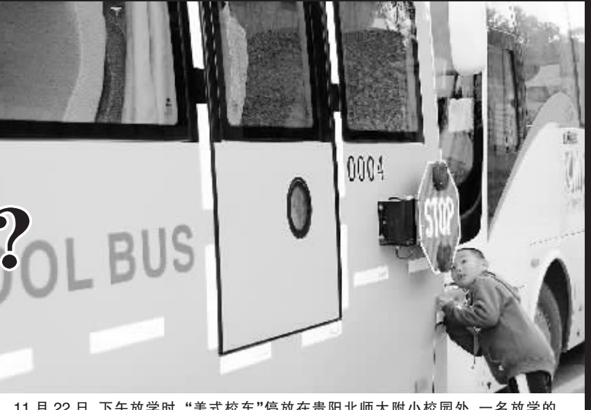
11月22日,下午放学时,“美式校车”停放在贵阳北师大附小校园外,一名放学的学生正在好奇的观看。

进行购物消费。正因为如此,不少人就借微博打起了网民的主意。据了解,目前大量的微博都夹杂了或多或少的广告信息,但出现的面目或多或少进行了变化。