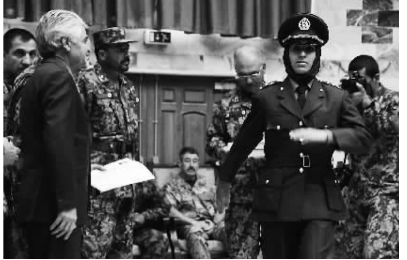
11月24日,在阿富汗喀布尔,阿富汗女军官在毕业典礼上列队行进。

日本气象厅说,北海道、青森县和岩手县有强烈震动,富山县、秋田县和山形县也有不同程度的震动。