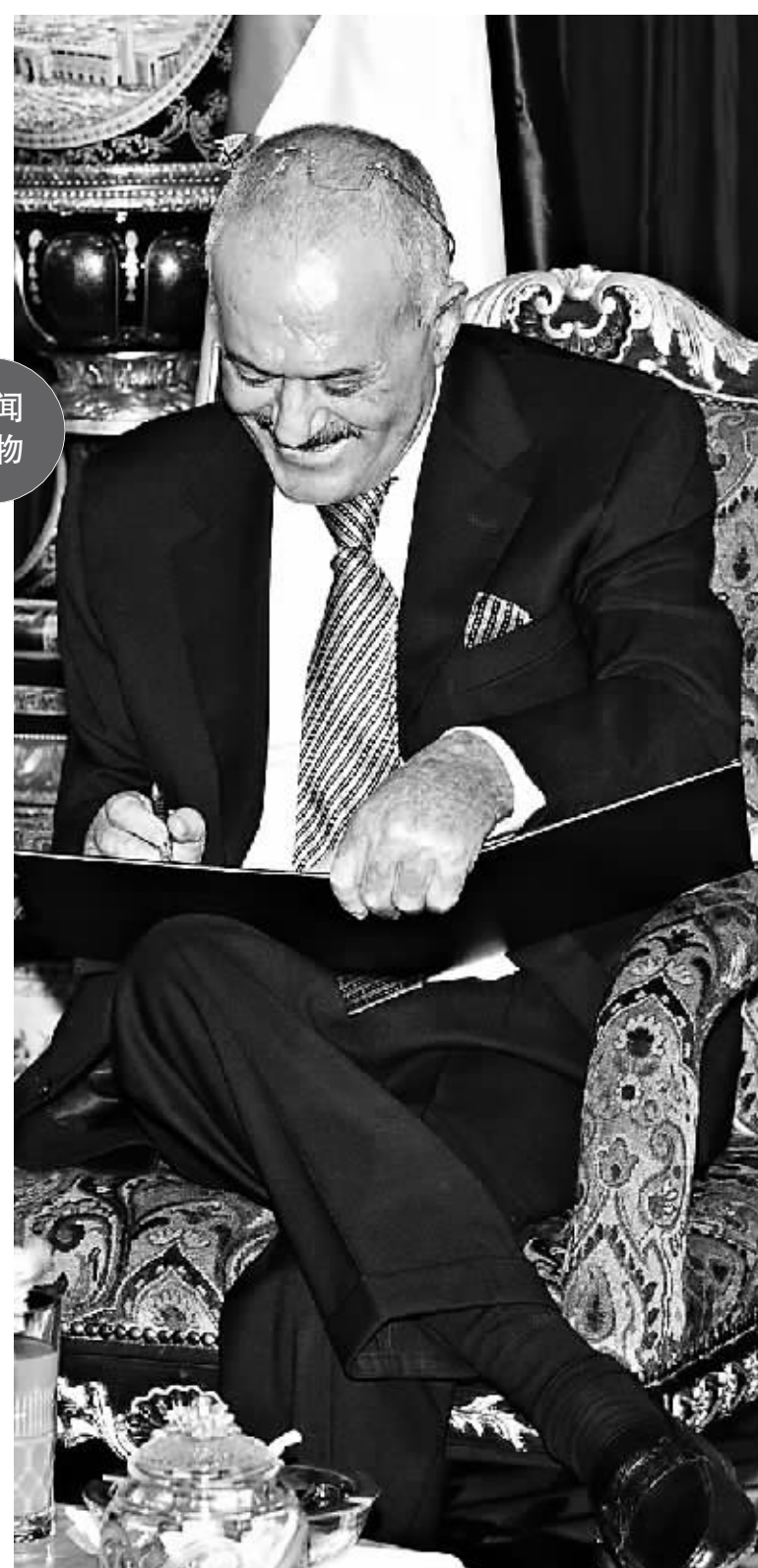
这张沙特通讯社11月23日提供的照片显示,也门总统萨利赫在沙特阿拉伯首都利雅得签署调解协议。

面对无可挽回的形势和各方压力,萨利赫11月23日重返利雅得,签署权力移交协议。韩建军(新华社供本报特稿)