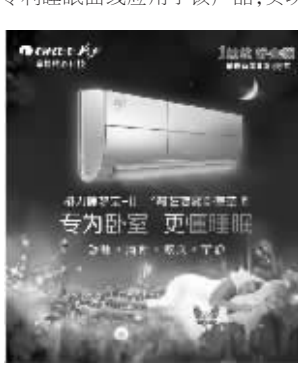
格力“睡梦宝II”是卧室空调的全新升级。

格力“睡梦宝II”是卧室空调的全新升级。睡梦宝II，不仅是卧室空调，更是一种健康时尚的生活态度。