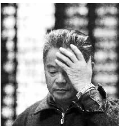
11月30日，一名股民站在南京一家证券营业厅的股指显示屏前。

【本报讯】周三A股两市早盘小幅低开，股指一路下滑，开盘一个小时之后，国际板传言再度袭来，B股指数出现跳水，两市股指也随之跌幅扩大。午后两市略有企稳，短暂横盘之后恐慌情绪再度蔓延，板块个股争相杀跌，部分个股出现本轮调整甚至上市以来新低。 截至收盘，沪指报2333点，跌78.98点，跌幅3.27%，成交722.2亿元；深成指报9693点，跌319.56点，跌幅3.19%，成交712.3亿元。本月沪指累计下跌134点，跌幅5.46%；深成指累计下跌787点，跌幅7.51%。