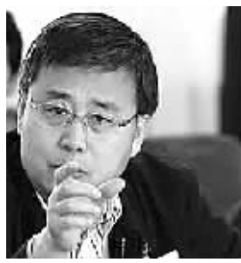
证监会主席郭树清

新华网深圳12月1日电 (记者赵瑞希)1日,在第九届中小企业融资论坛上,新任的证监会主席郭树清首次就资本市场发表公开演讲。他表示,我国资本市场存在明显缺点和不足,下一步证监会将从加强资本市场诚信建设、打击内幕交易等六个方面推进资本市场的改革创新和健康发展。 郭树清说,中国的证券期货市场还十分年轻,存在明显的缺点和不足。例如,行业和产品结构还很不完善,服务国民经济的广度和深度都需要拓展;内在约束机制还不健全,一些市场主体诚实守信、规范守法的意识相当淡薄等。 郭树清表示,这些发展过程中的问题只能在发展中得到解决。下一步,证监会将从加强资本市场诚信建设、打击内幕交易