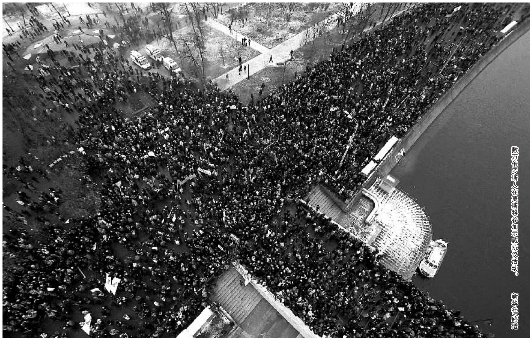
数万俄罗斯人在莫斯科参加示威抗议活动。

另外,统俄党透露,统俄党及梅德韦杰夫、普京的支持者计划12月12日在莫斯科另一个广场举行集会活动。