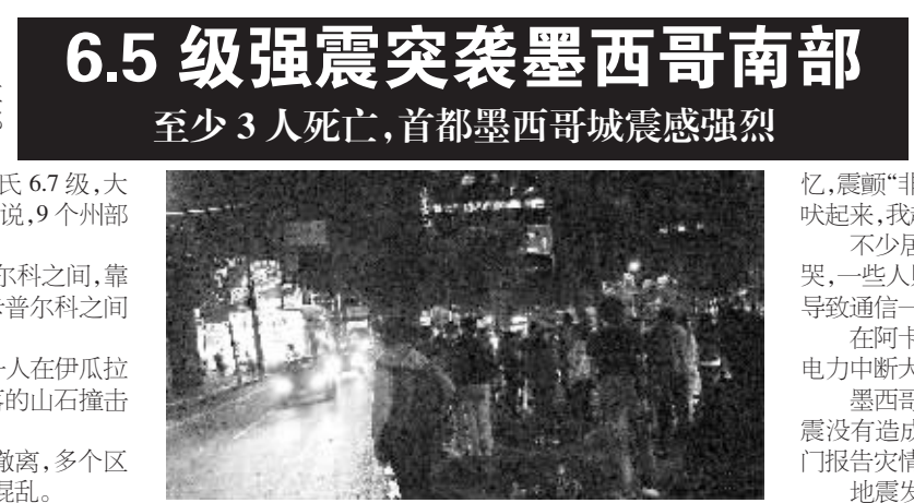
12月10日，在墨西哥城，人们在墨西哥南部地区发生地震后离开居所停留在户外。

墨西哥城高层建筑摇晃，部分商店人员撤离，多个区域电力供应中断，交通信号灯关闭，引发交通混乱。墨西哥石油公司说，这家企业营运没有受到影响。在墨西哥城，地震引发恐慌，众多居民涌上街头，不敢