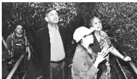
专家们在呀诺达景区参观。

国家旅游局开展了一系列的尝试和实践。如 2007 年 9 月，国家旅游局发布《旅游资源保护暂行办法》，提出“旅游资源保护坚持严格保护、开发服从保护的原则”，要求旅行社、旅游景区、导游人员应担负起教育游客在旅游活动中保护旅游资源的职责。