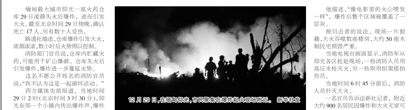
12月29日，在缅甸仰光，市民聚集在爆炸起火现场附近。

缅甸最大城市仰光一座火药仓库29日凌晨失火后爆炸，进而引发大火。截至北京时间29日傍晚，确认死亡17人，另有数十人受伤。路透社描述，仓库爆炸引发大火，浓烟滚滚，数小时后火势得以控制。消防部门官员说，仓库内贮藏火药，可能用于矿山爆破。仓库失火后引发爆炸，爆炸进一步蔓延火势。这名不愿公开姓名的消防官员说：“我不认为这是一起破坏活动。”西方媒体先前报道，当地时间29日2时(北京时间3时30分)，仰光东郊一个小镇内传出爆炸声，爆炸后被锁定的镇内一座与医疗物资相关的仓库。一名不愿公开姓名的警察证实，12名男子、5名女子丧生。随搜救工作深入，死伤人数仍可能上升。法新社援引政府消息源报道，17名遇难者中包括4名消防人员，另有包括大约30名消防人员在内的79人受伤。仰光综合医院一名护士的说法，医院收治伤员108人。美联社说，爆炸把仓库地面炸出一个直径6米、深4.5米的大坑。巨大的爆炸声使数以百计附近居民从睡梦中惊醒，他们之后惊恐地涌上街头。“我们听到巨大的爆炸声，看到空中黑烟弥漫。我们的房子在爆炸中晃动，我们不知道发生了什么。”一名附近居民说，“仰光不怎么发生炸弹爆炸之类的事情，所以我们原以为是陨石坠落。”科丁丹(音译)是一名出租车司机，爆炸时他恰巧开车经过仓库。他告诉媒体记者：“两、三名在30米开外的行人被碎片击中后死亡。”