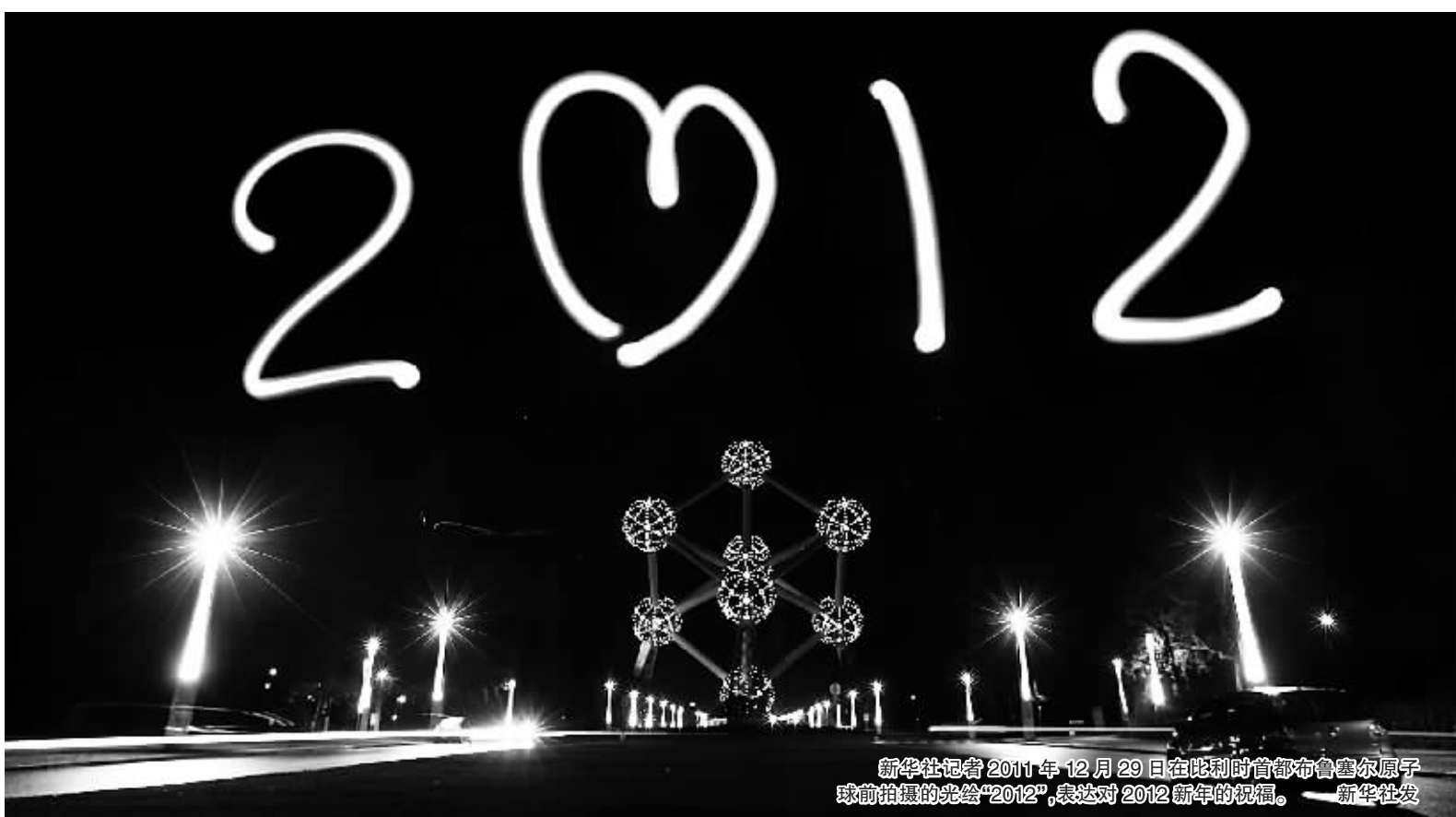
新华社记者在2011年12月29日在比利时首都布鲁塞尔原子球前拍摄的光绘“2012”，表达对2012新年的祝福。

新华社专电 伊朗海军准将马哈茂德·穆萨维29日说，伊朗海军在邻近霍尔木兹海峡的军事演习区域发现一艘美国航空母舰。作为伊朗军演发言人，穆萨维告诉伊朗官方的伊斯兰共和国通讯社：“伊朗海军侦察机发现，一艘美国航母在演习区域内。”海域内航母据信为“约翰·斯滕尼斯”号。穆萨维说，侦察机拍下航母视频和照片。一些美国官员28日说，“约翰·斯滕尼斯”号航母战斗群穿过霍尔木兹海峡。