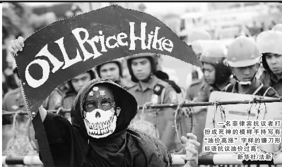
一名菲律宾抗议者打扮成死神的样子手持写有“油价高涨”字样的镰刀形标语抗议油价过高。