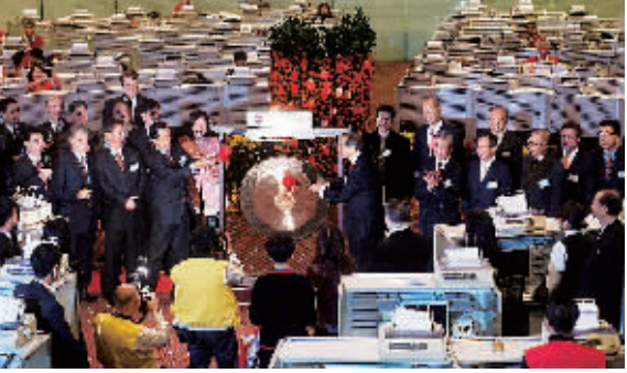
1月26日,香港交易所举行龙年首个交易日的开市仪式。