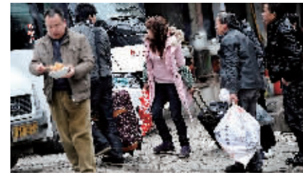
1月26日,人们带着行李走进湖北宜恩县长途汽车客运站。