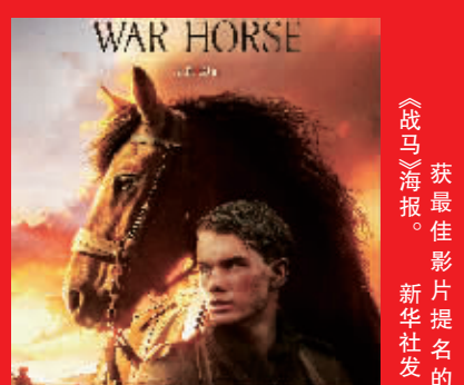
获最佳影片提名的《战马》海报。新华社发