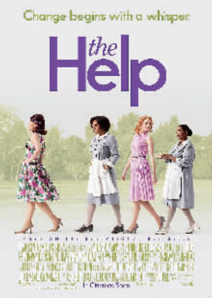
获最佳影片提名的《帮助》海报。

据新华社电 第84届奥斯卡奖提名名单当地时间24日晨在好莱坞贝弗利山塞缪尔·戈德温剧院揭晓。 主要奖项提名名单如下: 最佳影片: 《后人》《生命之树》《帮助》《点球成金》《战马》《艺术家》《午夜巴黎》《雨果·卡布里特》《特别响,非常近》 最佳导演: 伍迪·艾伦(《午夜巴黎》)、米歇尔·阿扎纳维修斯(《艺术家》)、亚历山大·佩恩(《后生》)、马丁·斯科塞斯(《雨果·卡布里特》)、特伦斯·马利克(《生命之树》) 最佳女主角: 格伦·克洛斯(《雌雄莫辨》)、薇奥拉·戴维斯(《帮助》)、鲁尼·马拉(《龙文身的女孩》)、梅里尔·斯特里普(《铁娘子》)、米歇尔·威廉姆斯(《我与梦露的一周》) 最佳男主角: 肯尼思·布拉纳(《我与梦露的一周》)、乔治·克鲁尼(《点球成金》)、克里斯托弗·普卢默(《初学者》)、尼克·诺尔蒂(《勇士》)、马克斯·冯·叙多(《特别响,非常近》) 最佳女配角: 贝内迪克特·韦伯(《艺术家》)、杰西卡·查斯坦(《帮助》)、珍妮特·麦克蒂尔(《雌雄莫辨》)、奥克塔维亚·斯潘塞(《帮助》)、梅丽莎·麦卡西(《伴娘》) 最佳男配角: 肯尼思·布拉纳(《我与梦露的一周》)、乔治·克鲁尼(《点球成金》)、尼克·诺尔蒂(《勇士》)、马克斯·冯·叙多(《特别响,非常近》) 最佳影片剪辑: 《龙文身的女孩》(雨果·卡布里特)、《点球成金》(战马)、《变形金刚3》 最佳音效剪辑: 《龙文身的女孩》(雨果·卡布里特)、《点球成金》(战马)、《变形金刚3》 最佳视觉效果: 《哈利·波特与死亡圣器(下)》(雨果·卡布里特)、《变形金刚3》(点球成金)、《铁甲钢拳》