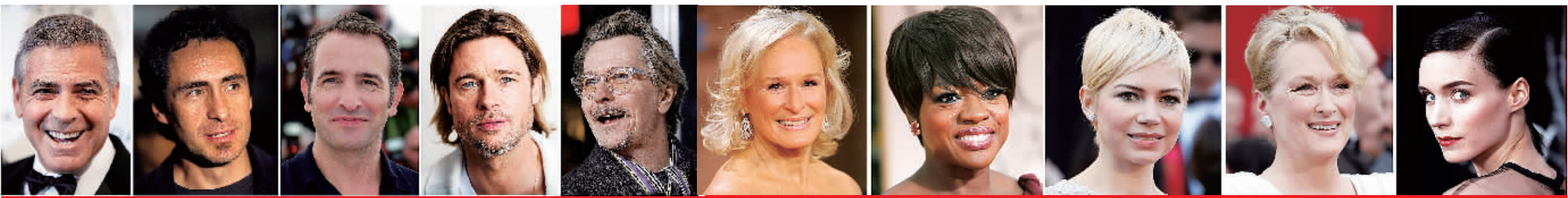
乔治·克鲁尼 德米安·比齐尔 让·杜雅尔丹 布拉德·皮特 加里·奥德曼获影帝提名 格林·克洛斯 维奥拉·戴维斯 米歇尔·威廉姆斯 梅丽尔·斯特里普 鲁尼·马拉获影后提名