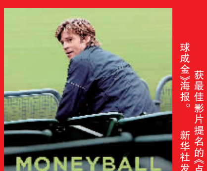
获最佳影片提名的《点球成金》海报。