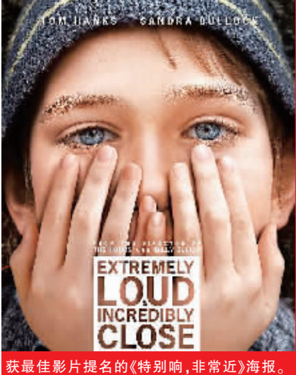
获最佳影片提名的《特别响,非常近》海报。