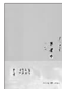
生活·读书·新知三联书店 2012年1月

该书是“郑震旅行图文小说系列”的第一部,讲述了主人公“我”和同伴“大吉岭小姐”的印度旅行故事。“我”是一名来自北京的年轻旅行者,沉默腼腆敏感,每天都要通过电话向在国内的未婚妻阿真交流“报喜不报忧”的旅行故事;“大吉岭小姐”是在印度长大的加拿大华裔女孩,旅行中她对这片土地既亲近又逃避,极力找寻归属感,却又屡屡受挫……他们带着读者穿行于德里、加尔各答、瓦拉纳西、大吉岭、特努什艾迪……期间偶遇各色人等,围绕主人公和各色人物,作者以立场、感情近乎零度介入的客观视角,通过一连串的故事,构筑出一个让人着了魔的印度,一个你不曾听说,从未见过,散发着强烈疏离感的国度。