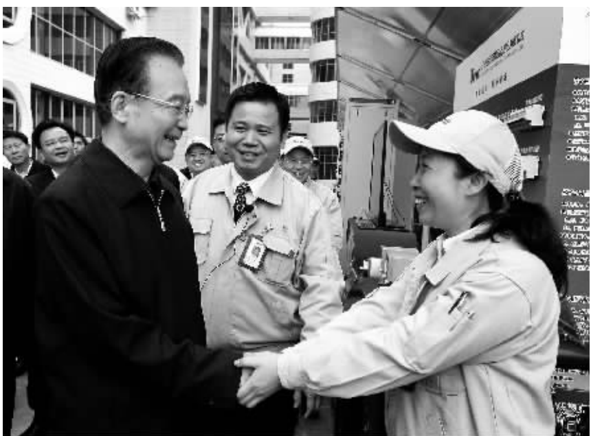
2月3日至4日,温家宝总理到广东省走访企业、村庄,考察人才市场和海关物流园区,召开座谈会,听取基层干部群众对政府工作的意见和建议。

二十年前,小平同志不顾八十多岁的高龄来到广东,讲了许多语重心长、发人深省、具有深远历史意义的话。他明确告诉我们,要坚持改革开放不动摇,不改革开放只能是死路一条。这些话我以为至今仍有强大的震撼力,而且有着巨大的指导意义。