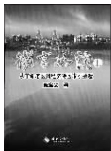
陈全义著,海南出版社 2011年12月出版

书的开篇讲道:“北镇固山,也叫医巫闾山,是辽、金的发祥之土,也是满族的中兴之地。这座大山,从辽宁的东北伸向西南,像一条半卧半起的龙,它的脊梁拱起,头伸向大海,随时准备跳将起来,去腾云驾雾。那百里长山,蓬勃着千年松柏,山中晨钟暮鼓,隐藏着古刹幽居,佛寺庙道众多,个个依隙而居。而王屯儿就是这山下的一个村子。”对东北的每一座山和那山上的每一棵树,以及山下的每个村庄,在作者的脑海里是那样的熟悉,就像是自己刚刚关上了家门走