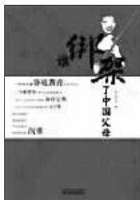
江苏人民出版社 出版

作者长达十年的陪读经历,累积了很多关于教育、关于音乐学习、关于父母陪读的深刻思考。什么样的父母才能胜任陪读的岗位?如何帮助孩子建立目标并养成始终如一的目标做事的习惯?如何和孩子谈心谈话“恋爱”?作者给予了十分具体通俗的回答。有理念,有做法,有见证。