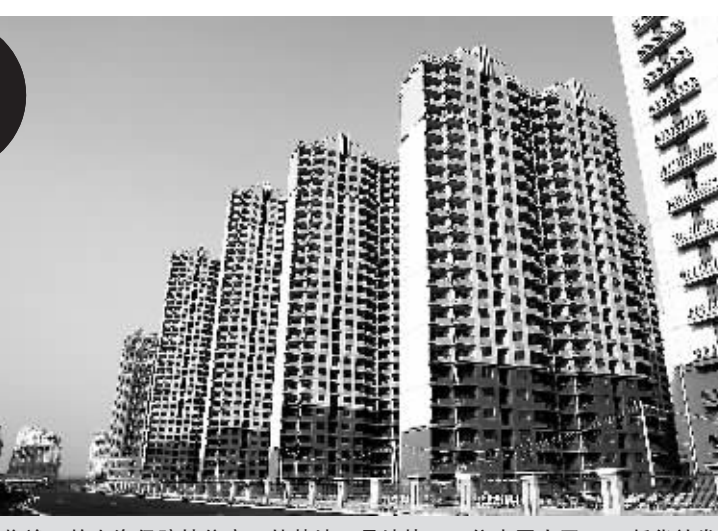
即将竣工的上海保障性住房三林基地7号地块——依水园小区。

这只是核对该中心处理的一起普通案例。它之所以有如此“神通”,得益于上海近年来探索建立的“居民经济状况核对平台”。这一平台通过建立“电子比对专线”,涵盖社保、税务、公积金等14个部门和单位,从而能把分散的居民经济状况信息进行充分整合、比对。核对该平台的“主建设方”上海市民政局局长马伊里说:“上海居民经济状况核对平台,就像是一套全方位的监控系统,能够较为全面准确地了解申请者的经济状况。”