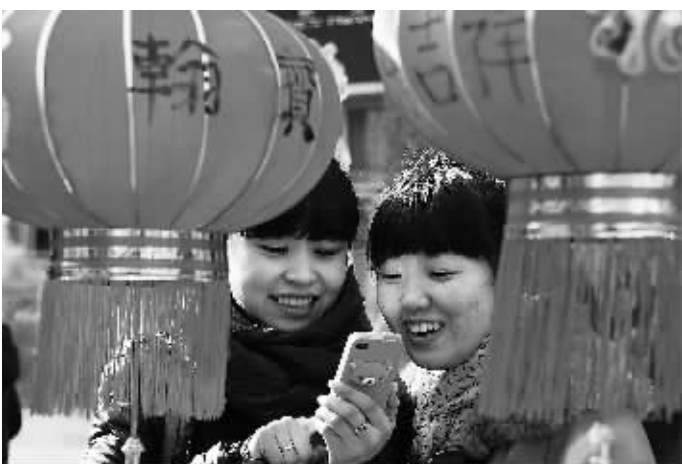
2月5日,哈尔滨市市民在红灯笼前用手机拍摄的照片。