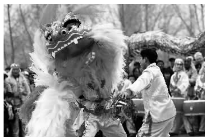
2月5日,一支民间表演团队在郑州绿城广场表演舞狮。