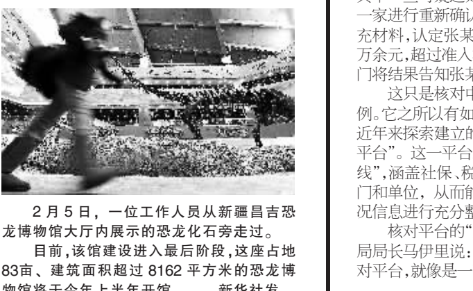
2月5日,一位工作人员从新疆昌吉恐龙博物馆大厅内展示的恐龙化石旁走过。目前,该馆建设进入最后阶段,这座占地83亩、建筑面积超过8162平方米的恐龙博物馆将于今年上半年开馆。