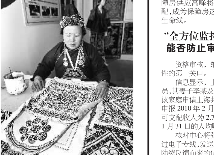
2月5日,民间艺人在演示苗族蜡染技艺。当日,中国非物质文化遗产生产性保护成果展在北京全国农业展览馆新馆开幕。