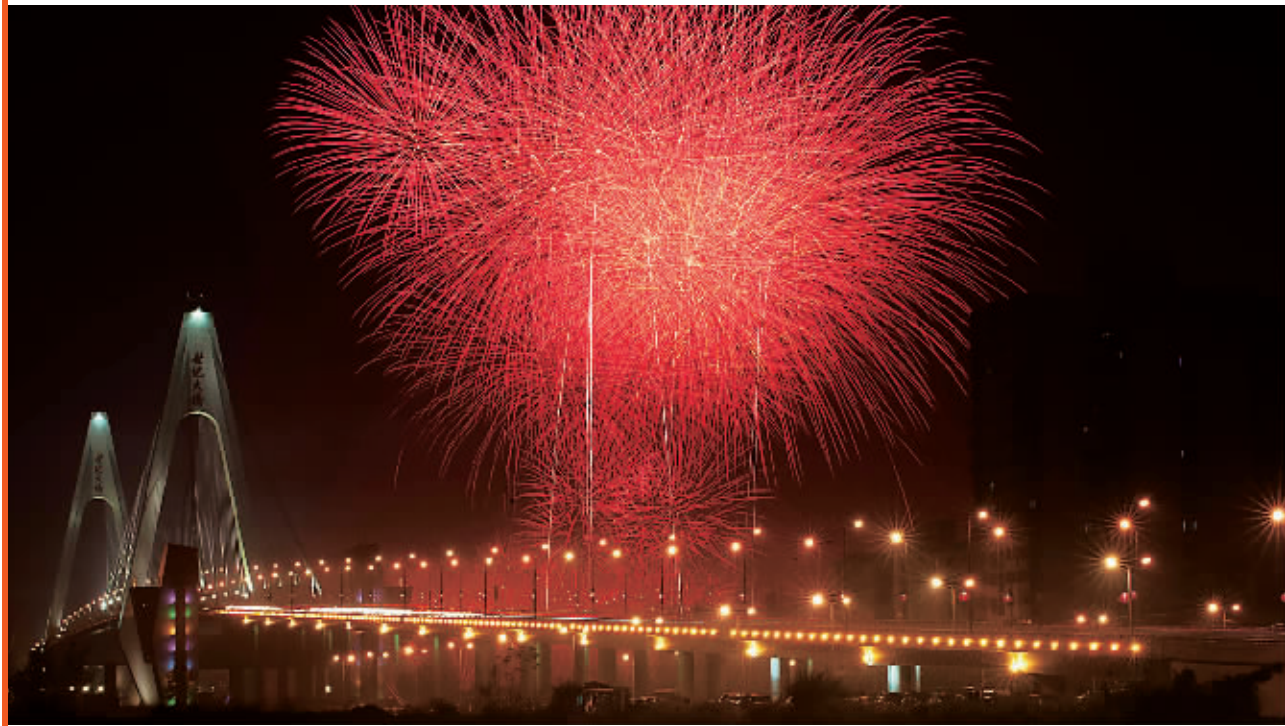
↑ 2月6日元宵之夜,海口湾畔烟花璀璨,喜庆气氛浓烈。