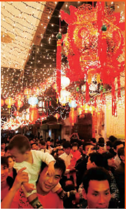
↑ 2月6日,在海口市府城马鞍街,市民在观看五彩缤纷的花灯。当晚,一年一度的府城换花节举行。