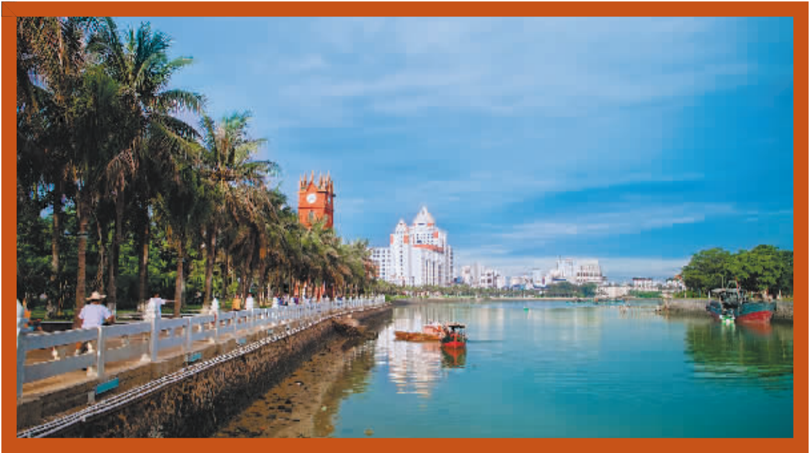
钟楼恰好是海口故所城诸街往北辐辏之点。

摧残的厄运。据海口建筑设计室的建筑师林志民先生介绍：“文革”时期，欧式钟楼虽然没有拆除，但是钟楼顶上箭簇尖角被削除成平顶，各层的窗子被封堵上，四面墙体被砌筑灰白色的水刷石，改装成“最高指示”宣传墙。