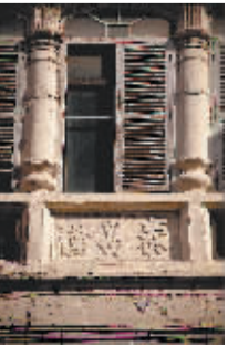
海口老商号泰昌隆。

海口设市于1926年12月9日。就在设市后的一年多一点，也就是1928年，一座欧式的钟楼矗立在了海甸溪的边上。她是农业文明与海洋文明的交媾、封建帝国与资本主义碰撞的产物。