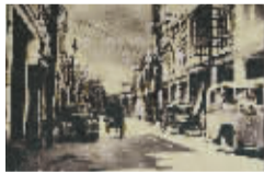
古老的骑楼是老海口凝固的城市记忆。

望海，隔岸是万家灯火、气象日新的海甸岛；南倚长堤路，像是海口百年旧城和府城千年故都的咽喉，得胜沙路、新华路、博爱路，中山路等海口老街从空间上汇聚于此；往东，次第是人民桥、和平桥，遥遥南渡江；往西，则有长虹卧波、飞龙饮涧的世纪大桥，良顷千亩八方开放的万绿公园……一直到世界宾朋纷至沓来的假日海滩。