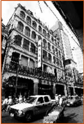
海口得胜沙老街的“五层楼”。