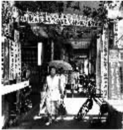
海口老街老凉茶店。