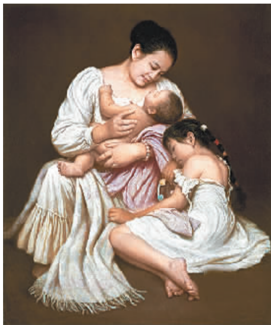
李自健油画《母女系列》之一《生之梦》

持续40天的“人性与爱·李自健油画新世纪巡展”2月19日徐徐闭上帷幕。许多观众投来恋恋不舍的目光，与这一个月来沉浸其中的感人画面话别。186幅作品，每一幅的背后都饱含一个爱的主题，闪烁着人性的光辉，温暖着这个有些寒冷的春天。这个震撼过世界上很多角落的全球巡回展，是至今为止仍在运转不断的个人大型油画展。它所赢得的不同国籍、不同文化背景的人们的喜爱和追捧，大大超出了人们的想象，超越了画展本身的意义。