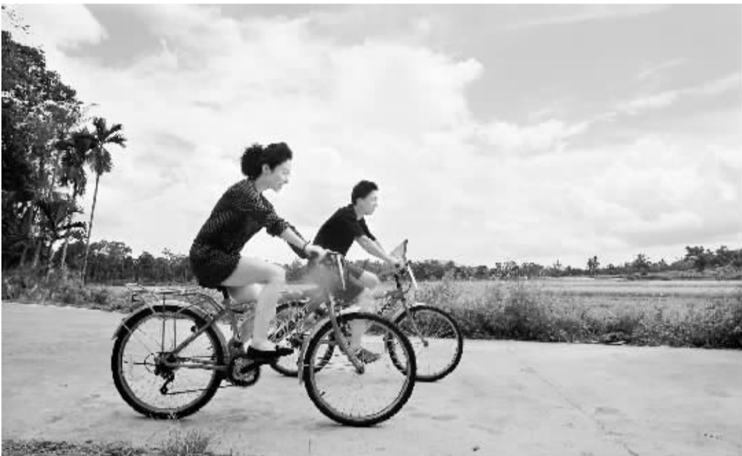
在百里百村骑车乐游

冷泉、亚洲榕树王、旧市城、皇坡村、母瑞山……这些都是定安“百里百村”所拥有的独特名词。这里有迷人的田园风光、感人的红色故事、醉人的远古古风、诱人的富硒生态美食。