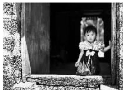
翰林镇旧市村的孩子。

脚的食客过多，店里已无猪脚可卖。为了能将正宗的翰林猪脚带回去，他只好在定安居住了一晚，等待新鲜的猪脚出炉。