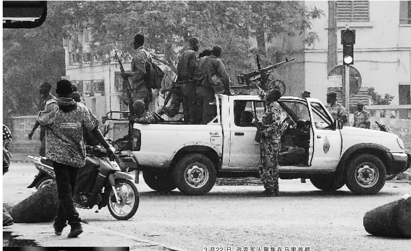
3月22日,政变军人聚集在马里首都巴马科的国家电视台门前。