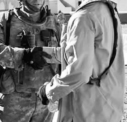
2011年8月23日,罗伯特·贝尔斯(左)在加利福尼亚州欧文堡的国家训练中心。新华社/法新(资料照片)

贝尔斯的行凶动机依然不为外界所知。美联社22日援引美国警方一份记录报道,贝尔斯2008年涉嫌酒后施暴,性骚扰一名女性且殴打她的朋友。