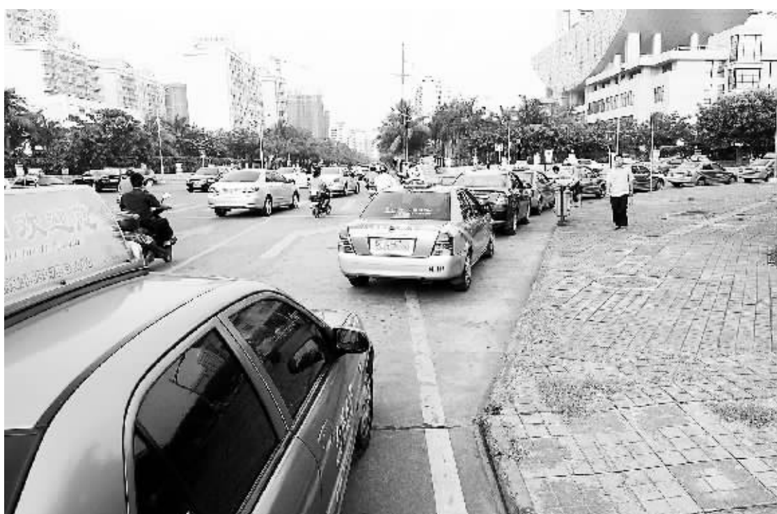
等待加气的出租车排队。海南车用沼气新能源示范项目暨沼气工厂3月29日开工,将于今年年底建成,届时将全面向海口市公交车及出租车供气。

据介绍,车用沼气的有机原料来源包括市政生活污水泥、分类后的有机生活垃圾、猪粪、香蕉秆、水果加工残渣等,项目主要利用现代工程技术和生物技术,建造不受自然条件制约的沼气工厂,在处理废弃物的同时,把沼气作为能源商品进行生产和销售。 省工信厅厅长丁尚清说,海南具有