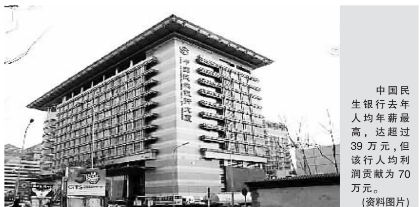
中国民生银行去年人均年薪最高,达超过39万元,但该行人均利润贡献为70万元。(资料图片)

报显示,民生银行人均年薪超过39万元,是7家已公布年报上市银行中最高,但该行人均利润贡献只有70万元,不及浦发、深发展和兴业,仅高于农行、华夏和建行;而建行人均利润贡献达51.4万元,但去年的人均年薪不到11万元,在7家银行中垫底。