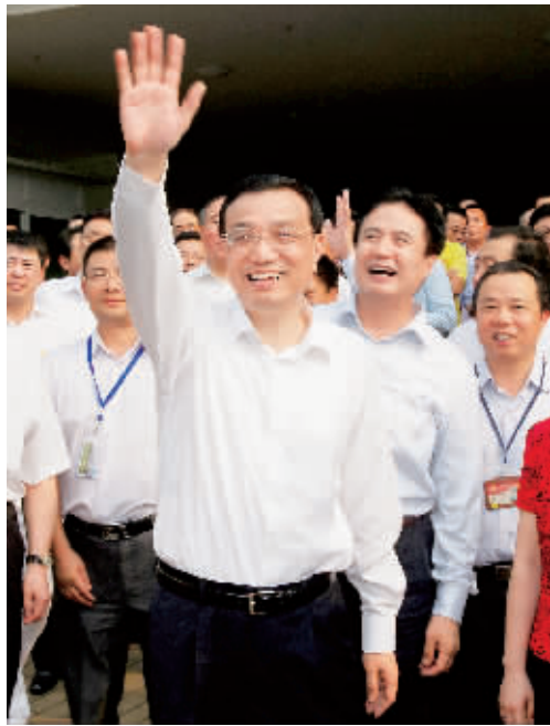
3 月 30 日，李克强在海南生态软件园考察调研时，向园区的工作人员挥手致意。