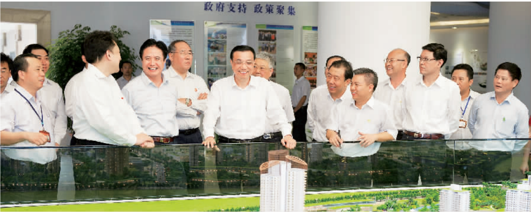
3 月 30 日，李克强来到位于澄迈县老城高新技术产业示范区的海南生态软件园考察调研，详细了解海南现代信息服务业和高新技术产业的规划、发展情况。