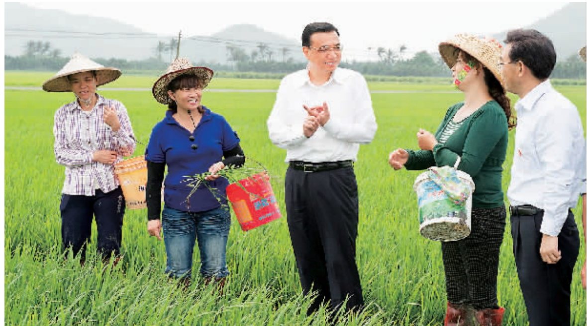
3 月 31 日，琼海市博鳌镇北山洋，李克强走到田间地头与正在秧田里劳作的村民亲切交谈。在仔细了解高产水稻的种植和市场情况后，他掰起手指帮村民算起了增收账。