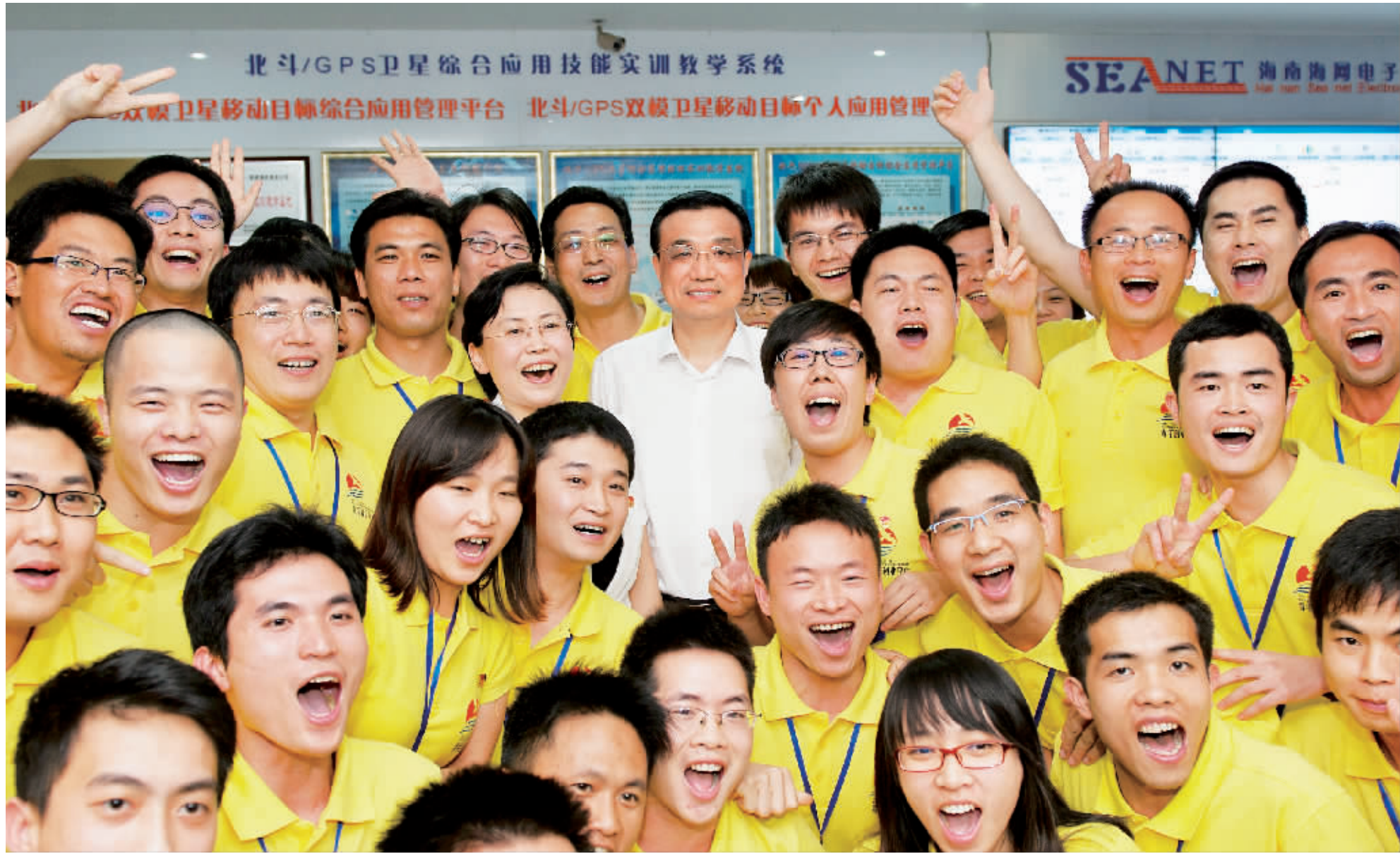
3 月 30 日，海南生态软件园青年创业平台的创业青年热情邀请李克强一起合影留念。这些创业人员中包含了留学生、大学生和海南籍返乡青年等，创业项目涉及互联网、旅游、信息技术、电子商务等多个领域。