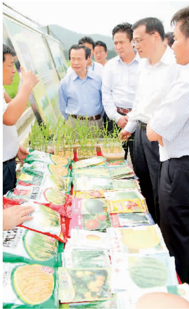
3 月 31 日，李克强在博鳌北山洋考察海南现代农业生产情况，听取我省现代农业、粮食生产和南繁育种情况介绍。