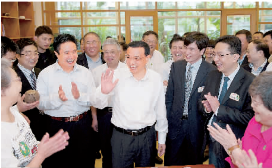
3 月 31 日，李克强来到社会养老机构海口恭和苑，看到老人们老有所养、老有所乐非常高兴。