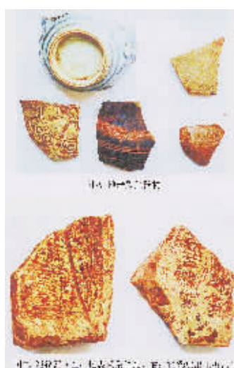
和出土的遗物(下) 本报记者 陈耿 翻拍

在地表踏查环节,考古人员在城址内外采集到了各类遗物,有陶、瓷、石等不同质地的器物残片,可辨器形有绳纹板瓦、筒瓦、瓦当、青砖、罐、盘、碟、碗、缸等生活用品和建筑用品,器物年代一直从汉、唐、宋时期到明