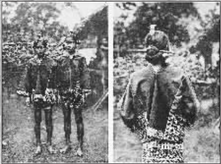
白沙峒黎着美丽的传统服饰的妇女