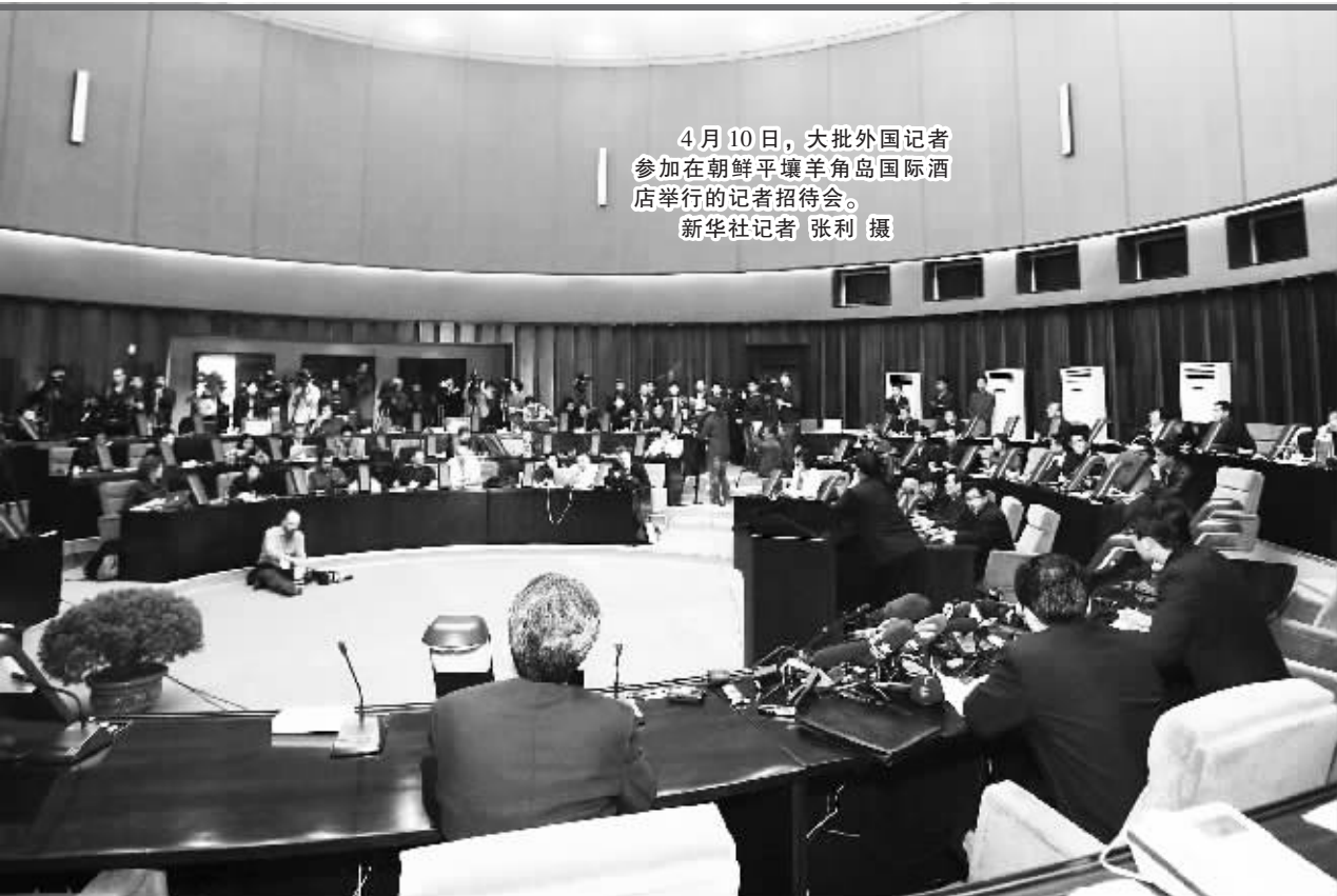
4月10日,大批外国记者 参加在朝鲜平壤羊角岛国际酒 店举行的记者招待会。

柳今哲在新闻发布会上承认用于发 射卫星和弹道导弹的火箭有相似处,但声 称发射弹道导弹需要为火箭加注固体燃