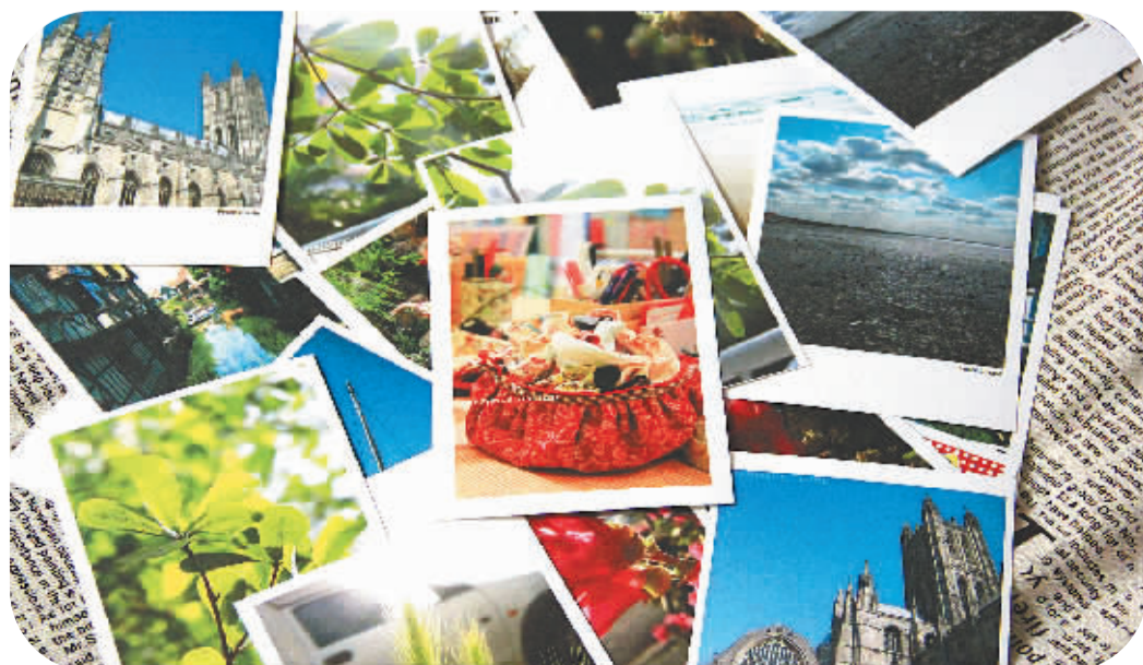
莉兹的明信片五彩缤纷。