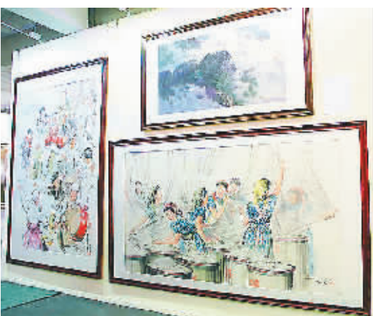
◀在 2012 艺术北京现场,一家画廊代理的朝鲜美术作品让观众感到新奇。 小新发