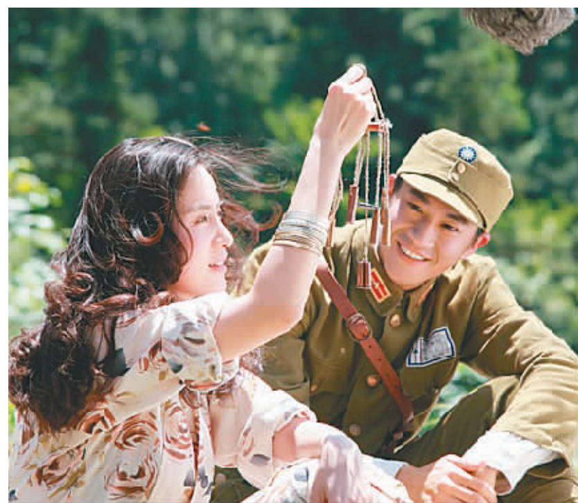
电影《遍地狼烟》剧照

本报讯 电影《遍地狼烟》近日正式入围今年8月将在加拿大举办的第36届蒙特利尔国际电影节，该片导演胡大为证实了这一消息。