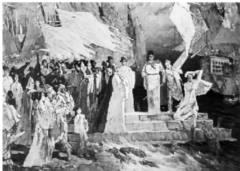
在世界文明交流与交汇史上，以郑和远航为代表的中华民族对外交往最文明，也最和平。