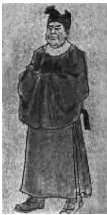
民间流传的郑和像

受郑和航海事迹的影响，永乐十五年（1417年）苏禄国东王、西王和峒王率官员及家眷三百多人到中国访问，受到永乐皇帝朱棣的热情接待。苏禄国这个庞大的代表团在中国逗留了二十多天，后来归国途中，东王在今山东德州一带不幸染伤寒而亡。当地官员按中国君主的规格将其安葬，永乐皇帝亲书悼文