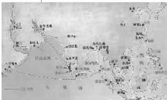
郑和下西洋路线图

今天看来，郑和船队无疑是当时世界上规模最大、最友好的外交使团，一位史学家曾这样评价中国历史上的这次远航：“自从有人类文明以来，文明之间就有交流、交汇。在整个文明的交流与交汇史上，唯有以郑和远航为代表的中华民族对外交往最文明，因为它最和平。”