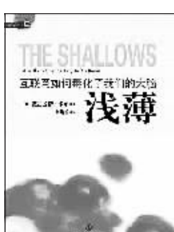
《浅薄 互联网如何毒化了我们的大脑》作者: [美] 尼古拉斯·卡尔 译者: 刘纯懿 中信出版社

起的、被各种电子产品包围的一代人,不仅没有更聪明、更开放、更有见识,反而是更加无知、偏狭和盲目的自我中心。他们有高度的竞争感,却没有真正的创造力,更愿意在既有的框架内、按照社会规范实现自我。 当然,你可以说不认同这种观点,甚至认为夸大其词。但至少在我们今天看来,这种说法却在一定程度上得到了可怕的应验。在国内的网络上,八卦、娱乐、游戏成为主要的话题,一个形体臃肿、造型怪异的笑容姐姐都能成为年轻人热捧的对象;一个特立独行、奇装异服、叼着烟卷在垃圾堆觅食的乞丐也被誉为“犀利哥”;动辄做出一些正常事情的人就被誉为“最美……”;浅显的、可复制的、群体性的娱乐八卦产品在大肆攻城掠寨。但你却很难看到一些稍具思想性、严肃性的话题爆红网络。年轻人成天沉迷于网上社交和电子游戏,不仅导致自我封闭,还失去了闲暇阅读的时间和对象,对重大主题的深层次理解。倘若我们不对此保持警惕,那么对信息的筛选很容易进入一个被娱乐和八卦扭曲的时期,从而陷入新的盲从与封闭。 尼古拉斯·卡尔在《浅薄》一书中指出:“互联网正在把人变成一个高速数据处理机一样的机器,失去了以前的大脑。”他不