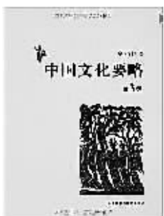
程裕祯著 外语教学与研究出版社

中国文化博大精深,源远流长。作者程裕祯老师以简洁的笔触,深入浅出地勾画出中国文化的历史渊源和发展脉络。 《中国文化要略(第3版)》承继了以前版本的全部内容,增加“精美器物”一章。全书分为地理概况;历史发展;姓氏与名、字、号;学术思想;宗教信仰;古代教育;典籍藏书等十七章。 新版除更正文字错漏,更新个别数据,调整版式及开本,增添近百幅精美插图之外,应读者要求,在每章之后新设“学习与思考”和“相关资料”板块,让这本精品教材更加贴近教学实践,臻于完美。