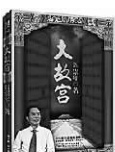
阎崇年著 长江文艺出版社

中国文化博大精深,源远流长。作者程裕祯老师以简洁的笔触,深入浅出地勾画出中国文化的历史渊源和发展脉络。 《中国文化要略(第3版)》承继了以前版本的全部内容,增加“精美器物”一章。全书分为地理概况;历史发展;姓氏与名、字、号;学术思想;宗教信仰;古代教育;典籍藏书等十七章。 新版除更正文字错漏,更新个别数据,调整版式及开本,增添近百幅精美插图之外,应读者要求,在每章之后新设“学习与思考”和“相关资料”板块,让这本精品教材更加贴近教学实践,臻于完美。