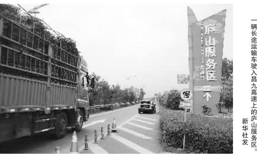
一辆长途运输车驶入昌九高速上的庐山服务区。

针对网友和货车司机所反映的情况，“中国网事”记者从九江上昌九高速，在高速上的庐山服务区休息了12个小时，第二天上午在新祺周收费站下高速，被收费站工作人员告知车辆“超时”，需交“超时费”。 工作人员称，按照最低限速要求，没在规定时间内跑完可宽限3小时左右，但超过这一时限则需按每小时100公里的时速算，收取每小时40元超时费。该名工作人员称记者所在车辆超出9小时，则需除过路费40元之外，再交“超时费”360元，共需交费400元。记者表示因为不了解规定，能不能少收点。通过10多分钟的交涉，该收费员最终没有收取所谓“超时费”，只收了40元通行费。该工作人员的理由是：记者所在车辆三个月内没有特殊情况，所以这次何时可以免除。 当记者询问为何无论是收费站、服务区还是沿路都没有相关提醒时，工作人员表示下高速到收费站就自然知道是否超时。并表示，一般私家车超时情况较少，所