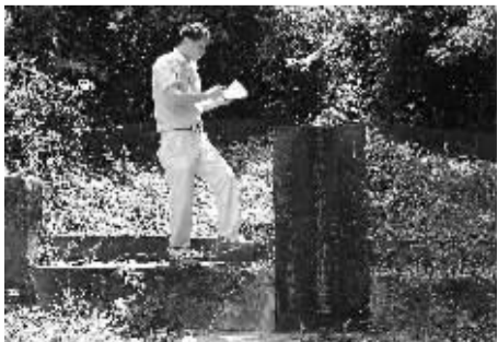
文昌龙楼镇陈笠村符元生墓。

据《符氏族谱》记载:符元生,字安行,原为河南宛丘(今河南省淮阳县)人,唐大顺二年(981年)因来琼抚黎,落籍文昌县,被族人奉为迁琼符姓始祖。