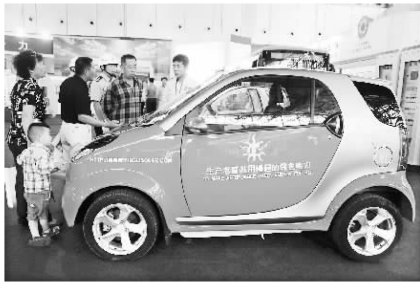
日前,在廊坊国际会展中心举办的新能源装备展上,人们被一辆光伏节能环保汽车吸引。

《决定》中提出了到2015年和2020年,战略性新兴产业增加值占国内生产总值的比重分别达到8%和15%的总体目标,而《规划》则对“十二五”的目标进一步细化。一方面,提出了产业创新能力、创新创业环境、对经济发展的引领带动作用等方面的具体目标,骨干企业研发强度要力争达到5%以上。