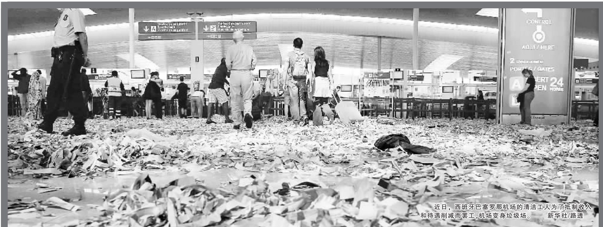
近日,西班牙巴塞罗那机场的清洁工人为了抵制收入待遇削减而罢工,机场变身垃圾场。