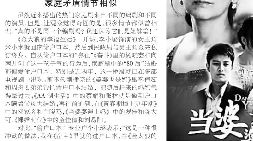
《当婆婆遇上妈》海报

本报讯 开机时便宣布锁定“2012年荧屏暑期档”的职场情感大剧《浮沉》，4日宣布于6月30日如期登陆深圳、东方、北京和浙江卫视黄金档。该剧由著名导演滕华涛确定为其“电视剧导演作品的收官之作”，加之集结《失恋33天》原班人马倾力打造，所以在即将打响的荧屏暑期大战中格外引人瞩目。 据介绍，该剧延续滕华涛导演最擅长的纪实风格，把社会热点隐藏在人物情感中，透过白百合扮演的菜鸟白领“乔莉”的职场成长和情感遭遇，折射出面对社会的快速发展变化的冲击的现代都市人，尤其是在商场拼搏的白领群体、耐人寻味的各种价值取向。 与电影《失恋33天》相比，编剧鲍鲸鲸这回在《浮沉》中显然给几位主演狠狠地加大了情感戏码。“黄小仙”白百合在剧中变