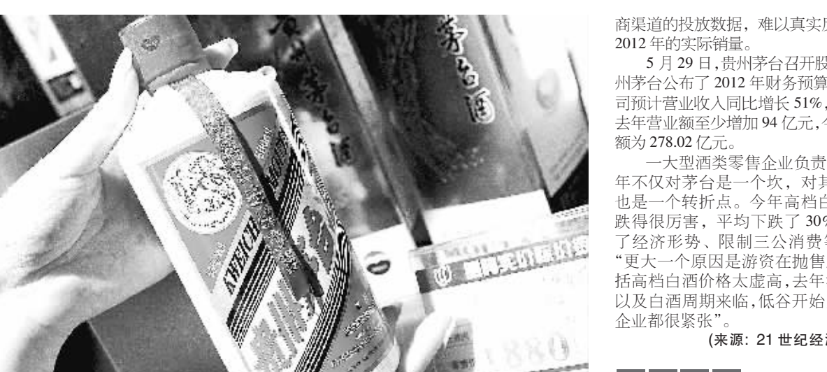
日前,上海市武宁路上一家茅台酒专卖店的营业员正在向记者展示降价后的茅台酒。一大型酒类零售企业负责人表示,今年不仅对茅台是一个坎,对其他高档酒也是一个转折点。

本报讯 一直遮遮掩掩的茅台酒投放量终于露出真容。6 月 7 日,记者在贵州茅台官网看到,2012 年 53 度茅台酒市场投放量为 9500 吨、43 度茅台酒 1300 吨。 遏制假酒泛滥 贵州茅台公布真酒投放量的目的是为了打假。在投放量信息后,茅台还同时公布了全国各片区打假办负责人的联系方式。一接近某大型白酒高层的人士透露,“茅台酒 90% 是假酒”并不是空穴来风,“行业内都在说茅台酒以茅台酒厂大门出是真酒,出了茅台镇就是假酒”。但一大型白酒销售企业负责人告诉记者,“茅台公布真酒供应量对于遏制假酒泛滥是有一些好处,但解决不了根本问题,因为茅台经销商众多、渠道混乱”。 特供渠道茅台数量则未公布 一长期追踪茅台的券商分析师告诉记者,贵州茅台去年销售茅台酒约为 1.3 万吨,该公司计划今年增加投放 1800 吨,预计今年销售量为 1.48 万吨。不过,贵州茅台此次公布的仅是经销商渠道销售的茅台,而走政府部门和军队特供渠道茅台数量则未公布。 贵州茅台史无前例地公布茅台酒 2012 年供应量,随之带来一个问题:贵州茅台公布的通过经销商渠道销售茅台酒 10800 吨,是否与茅台酒实际销量吻合? 贵州茅台 2011 年年报显示,贵州茅台去年共生产茅台酒及系列酒 3.95 万吨,销售额 184.02 亿元,其中茅台高度酒营业额 157.277 亿元,茅台低度酒营业额 12.23 亿元,茅台系列酒销售额 14.51 亿元。 贵州茅台在年报中一直仅公布销售额和产量,不公布茅台酒的实际销售量。不过,通过高度茅台酒的销售额以及 53 度茅台酒每瓶 619 元价格计算,仍能大致算出茅台酒的实际销量。去年 53 度茅台酒营业额为 157.277 亿元,出厂价为 619 元/瓶,以此计算,去年茅台高度酒销售量约为 1.27 万