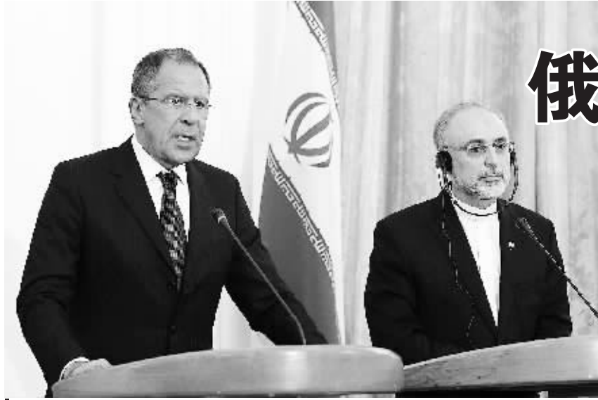
6月13日,正在伊朗访问的俄罗斯外长拉夫罗夫(左)在德黑兰指责美国政府在武装叙利亚反对派。

如果日本这种单方面行动继续下去,不仅会破坏中日友好大局,还可能撼动中日关系的基础,其危险不言而喻。而由此所体现出的膨胀心态,更是十分不利于东亚的稳定。当然,不论这场闹剧如何下去,不管日本右翼如何信口雌黄,也不管日本中央政府纵容事态发展到什么地步,都丝毫不能改变钓鱼岛是中国神圣领土这一事实。日方应立即停止制造新的事端,结束这场闹剧,拿出具体行动维护中日关系大局。(新华社北京6月14日电)