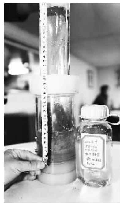
“蛟龙”号在海底取得的海水和沉积物样品。