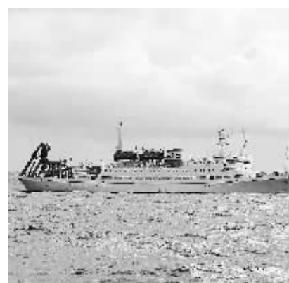
6月19日,成功完成下潜任务的“蛟龙”号母船“向阳红”号在海面上航行。