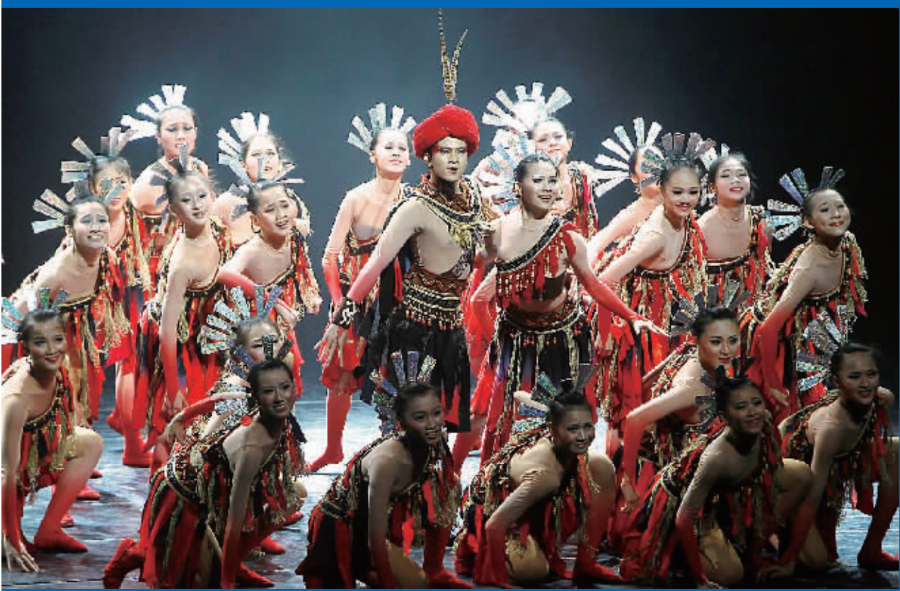
大型原创黎族舞蹈诗《黎族故事》海口演出剧照。

本报北京6月24日讯(记者戎黄晶)代表我省参加第四届全国少数民族文艺汇演的大型原创舞蹈诗《黎族故事》,25日晚将在北京天桥剧场举行首场演出,接受评委的严格评审。海南日报记者今天从汇演组委会获悉,该剧中的《黎锦》片段,已经入选参加将于7月6日举行的本届少数民族文艺汇演闭幕式的演出。 《黎锦》是《黎族故事》第三篇章“黎之情”中的一个片段,表现的是国家非物质文化遗产黎族织锦的灿烂与神奇。该片段演出时长达6分多钟,舞台效果也非常绚丽。