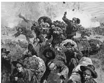
美刊插画:1880年代遭驱赶杀戮的华人

事后有人对此事说三道四,甚至还有人诋毁华人是低等民族,无意“把自己从暴政和压迫之下解放出来”。其实惨案背后的根本原因,还是就业竞争,也就是饭碗问题。