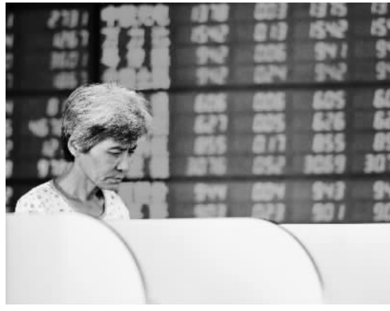
货币政策、房地产调控力度一直影响着A股的情绪。股指在6月下旬连续大幅下跌,不过在上半年最后一个交易日,一改颓势,大举上攻。

对比上半年国内外的经济形势而言,A股半年线收涨可谓来之不易。从宏观经济层面来看,一季度GDP增速回落至8.1%,而经济学家普遍预计二季度这一数据仍将下滑。来自国泰君安宏观研究报告指出,