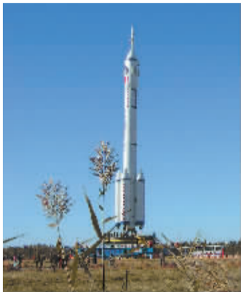
酒泉卫星发射中心待发射的火箭

从兰州继续往西,列车穿过神秘的河西走廊,经过荒无人烟的茫茫戈壁,使人倍感孤独、苍凉。酒泉这个戈壁里的绿洲,有着诗情画意的冰川雪峰、梦中驼铃,还有着苍莽的大漠孤烟、长河落日,境内山脉连绵、戈壁浩瀚,构成了酒泉雄浑独特的西北风光。