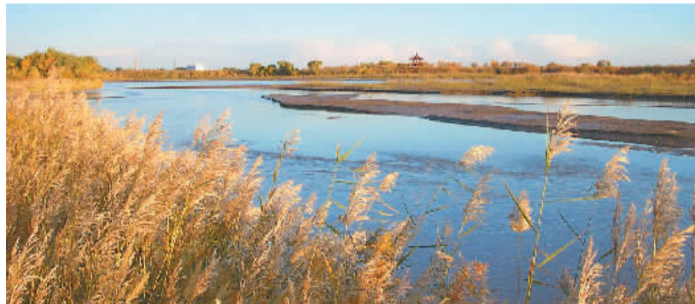
从东风航天城边流淌而过的弱水河

射中心到了。就是在这样的荒凉中有一座航天城,这里是科学卫星、技术试验卫星和运载火箭的发射基地,也是载人航天发射场。航天城是戈壁荒滩中的绿洲,1950 年代初建时是个牧场,经过半个世纪投入建设,基地里绿树成荫。是第一代航天城人从数百里之外运来泥土,辛苦地堆出了这个大漠之城。