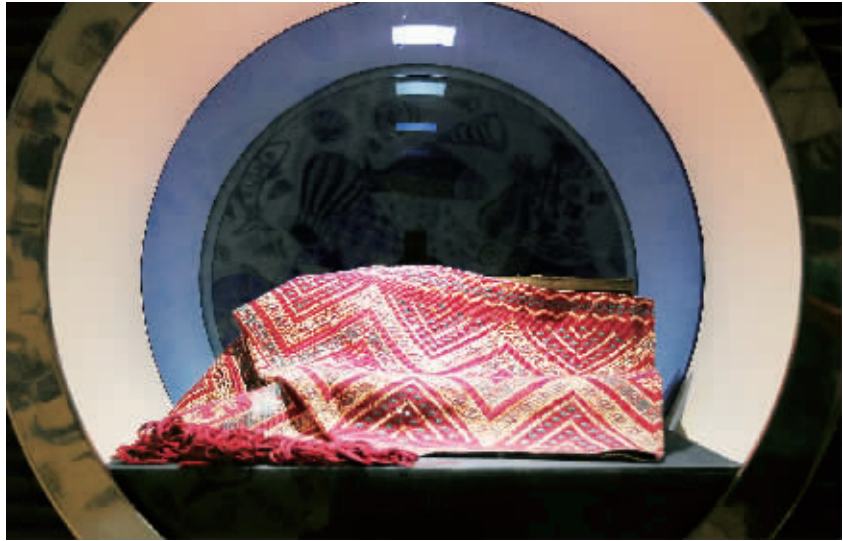
7 月 15 日，灿若云霞的非遗传织品——海南黎锦亮相丽水世博会。

本报韩国丽水 7 月 15 日电（特派记者单憬岗）澄绿的干层塔绿幽灵水晶、五彩精致的黎锦、惟妙惟肖的海南黄花梨雕品，“海南三宝”今天在丽水世博会中国馆海南活动周上的精彩亮相，获得了观众的好评。“海南三宝”摆放在中国馆海之源和海之恋两厅中间的走廊。处在正中的是黎锦，古称“吉贝布”，产自海南岛黎族居住区，是黎族人采用木棉花果内的棉毛织出的一种特色花布，是中国最早的棉纺织品之一，2009 年被联合国教科文组织列入急需保护的非物质文化遗产名录。水晶工艺品《蒸蒸日上》和海南黄花梨工艺品《善财观音》则分别摆放在黎锦的两边橱窗。省贸促会有关负责人介绍说，水晶工艺品《蒸蒸日上》原材料是产自海南屯昌的干层塔绿幽灵水晶，高 26.5 厘米、宽 12 厘米，“质量之好、体积之大、极为罕见，雕工保留这块料的原有形状，利用绿幽灵旁边的白色水晶，刻一条传统的中国龙把招财童子奋力托起，象征事业财富双至、蒸蒸日上。”