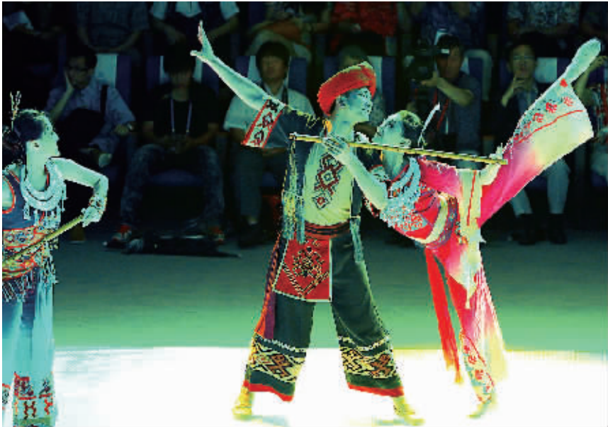
《黎族故事》中的精彩片段——《箫韵》。

本报韩国丽水 7 月 15 日电（特派记者单憬岗）今天的中国馆显得格外热闹，馆外排着长长的队伍，馆内观众掌声接连响起……“海南的舞蹈太吸引人了！”来自韩国首尔的申贤京说。一阵悠扬动人的音乐中，一群身着蓝色修身长裙的美丽少女迈着曼妙的舞步翩跹而至，在灯光映照下，仿佛一群海洋仙子信步在大海中。恍惚间，似有一阵清新的海风扑面而来……今天上午 10 时 45 分，由海南省歌舞团精心准备的世博会海南活动周开幕式 20 分钟表演，在观众的期待中拉开帷幕。作为海南活动周的特别演出，海南省歌舞团精心挑选了《黎族故事》演出团队中的 17 名优秀舞蹈演员，并选取《黎族故事》中的 4 个精彩片段——女子舞蹈《海》、女子舞蹈《取火》，双人舞与群舞《箫韵》，群舞《山海如画》，并增加情景演唱《邀请》，串连成一场 20 分钟左右的充满节奏与特色的歌舞表演。