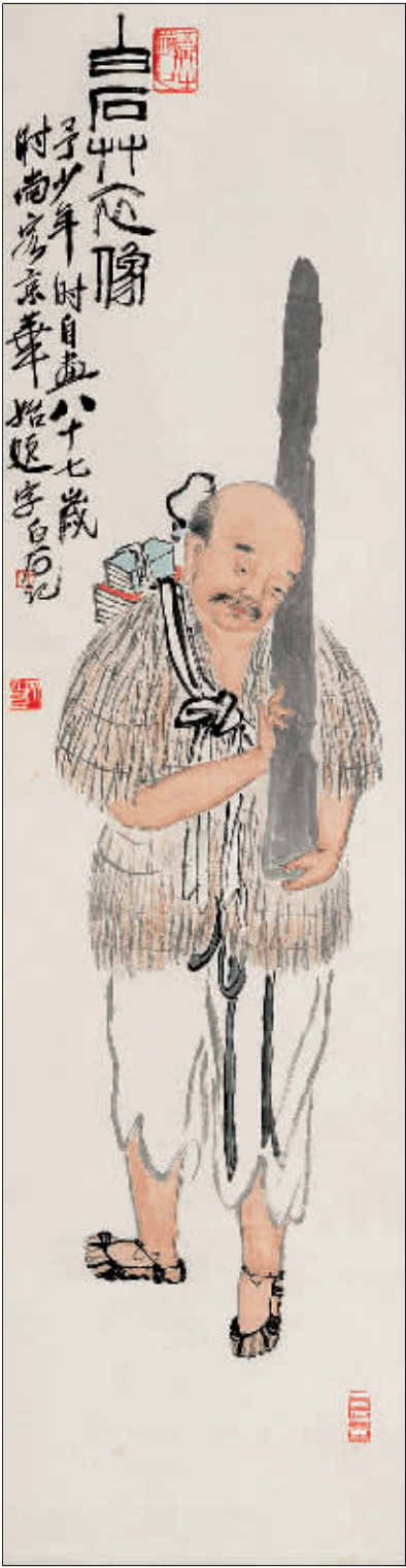
齐白石作品草衣图

虾、蟹、鱼、蛙这些水族类动物，在已往的历代绘画题材中，无论是宫廷绘画、民间绘画还是文人绘画，都很少涉及，既或偶一为之，也多是做为画面的点缀。而齐白石却以之作为画面的主体，一画再画，毕生不辍，并探索出了独特的笔墨表现技法，体现了他在绘画上卓尔不群的个性，反映了他独特的生活感受、思想情感与审美趣味。